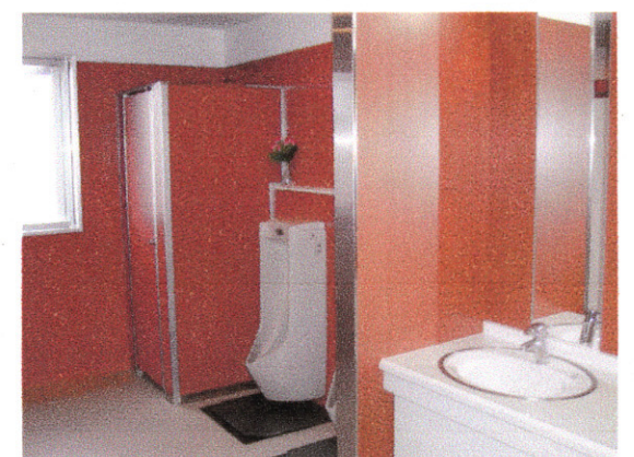
「ホテル並みのものを」との社長の思いで作ったトイレ。男性用はすべて和式。「洋式に座って眠ってしまわないようにね」。障害を持つ方などのために、女子トイレには洋式便器もある。